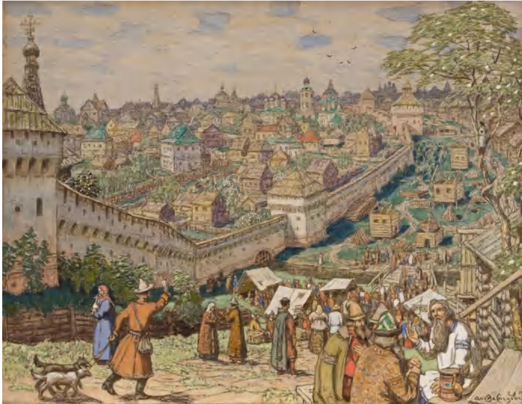
Москва в XVII веке