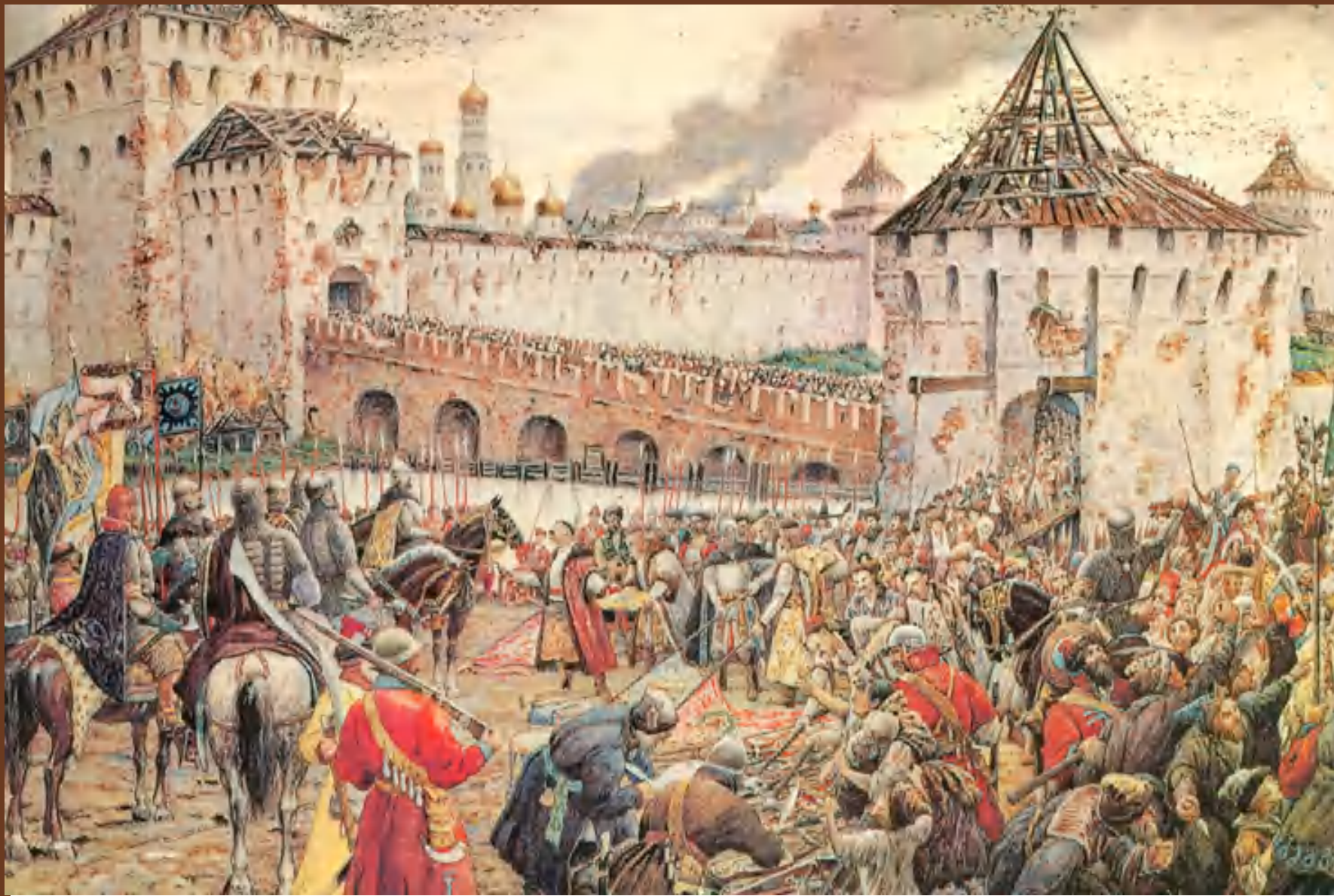
Изгнание поляков из Кремля