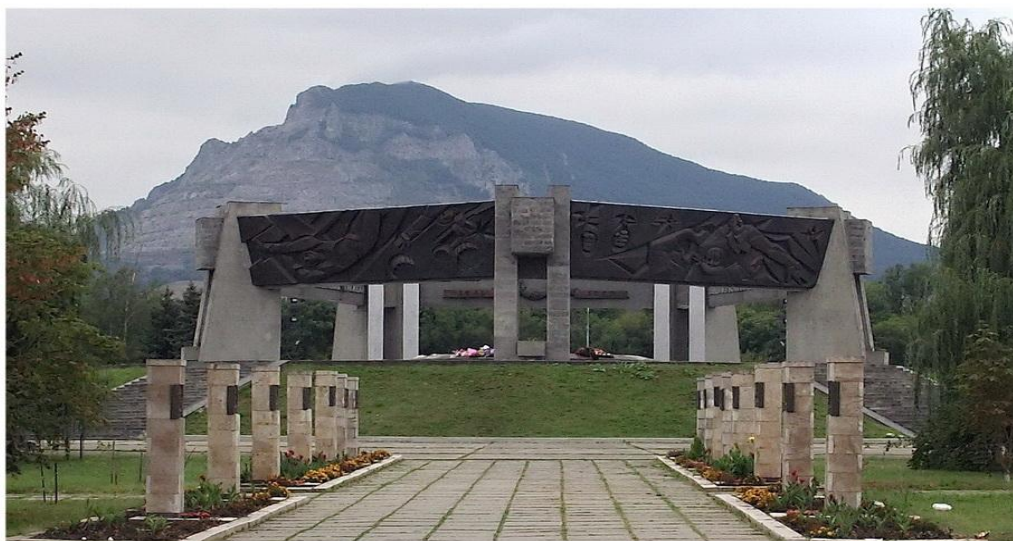
Аллея Славы мемориала "Огонь Вечной Славы" в г. Минеральные Воды

Прошли годы. Жители помнят о подвигах воинов, в каждом селе и районах города были установлены памятники погибшим. Создан Мемориал воинской Славы на площади Победа.