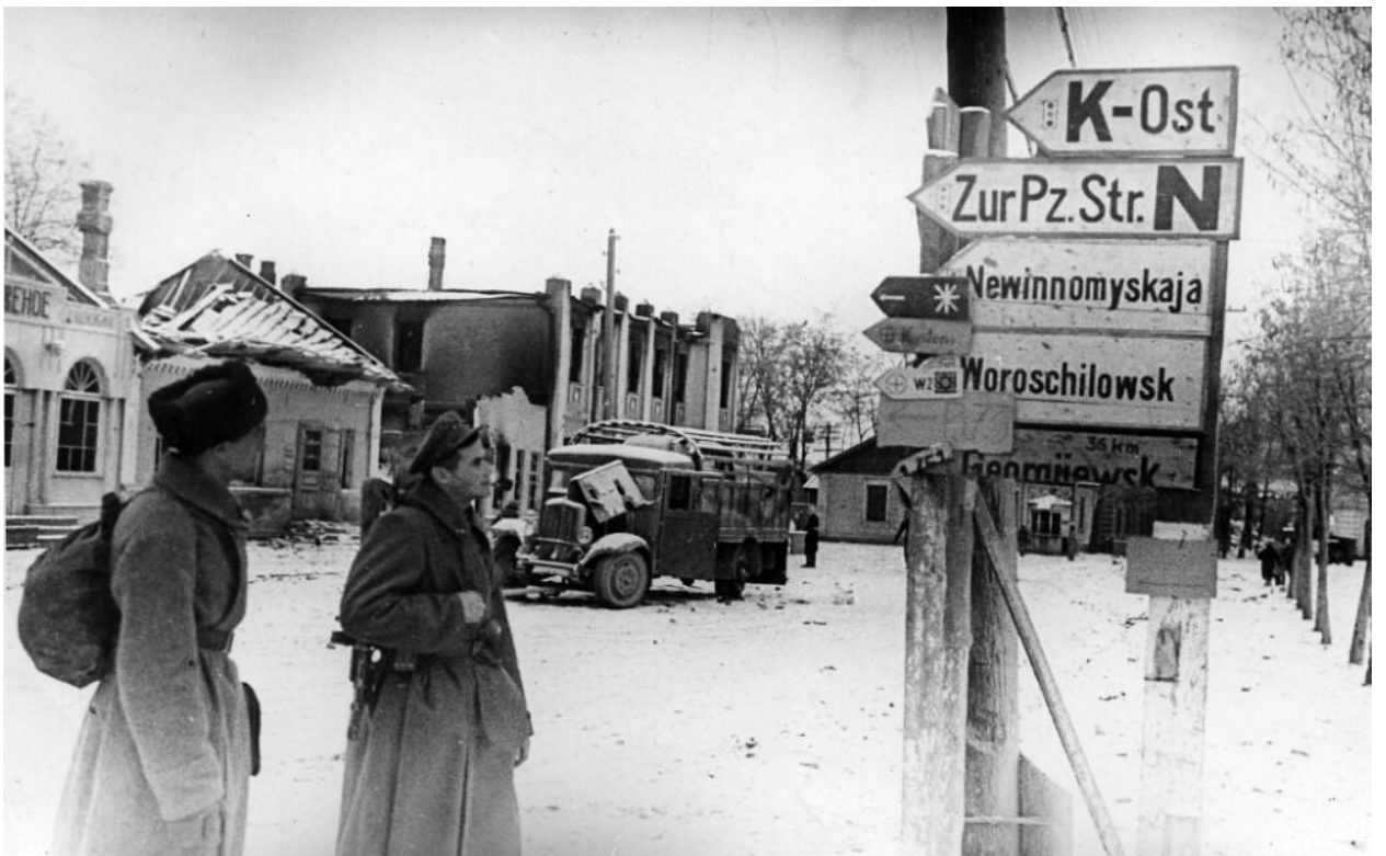
Улицы г. Минеральные Воды в первый день освобождения. Январь 1943 г. г. Минеральные Воды.